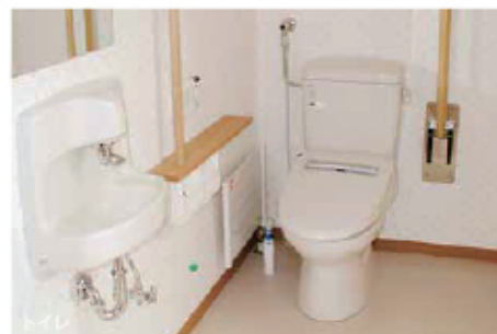
入浴・トイレは個別に支援致します。