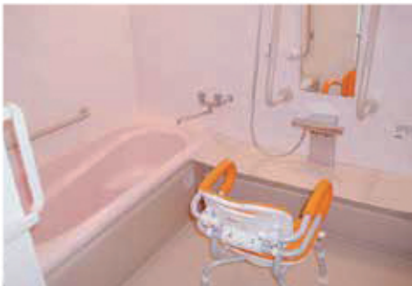
ユニットバスもご用意。