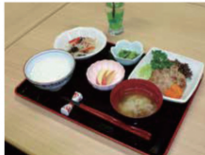
栄養バランスの取れたお食事をご提供しています。