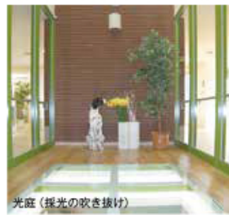
光庭 (採光の吹き抜け)